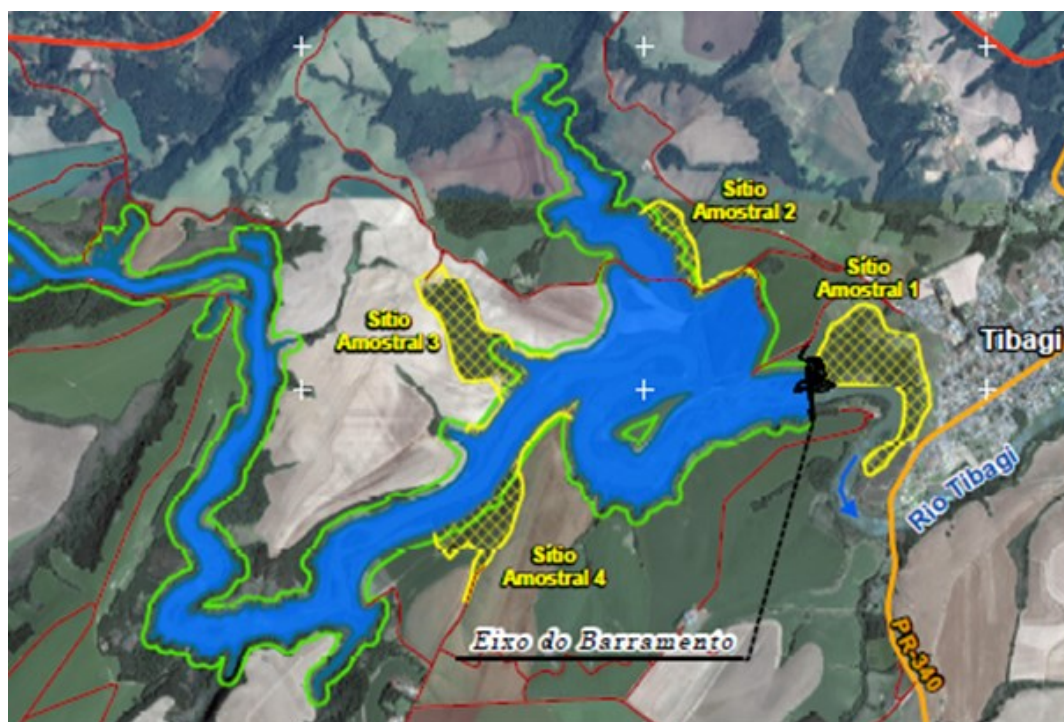
Figura 3.1.1 Localização dos 4 sítios amostrais do Programa de Monitoramento da Fauna Terrestre da UHE Tibagi Montante.