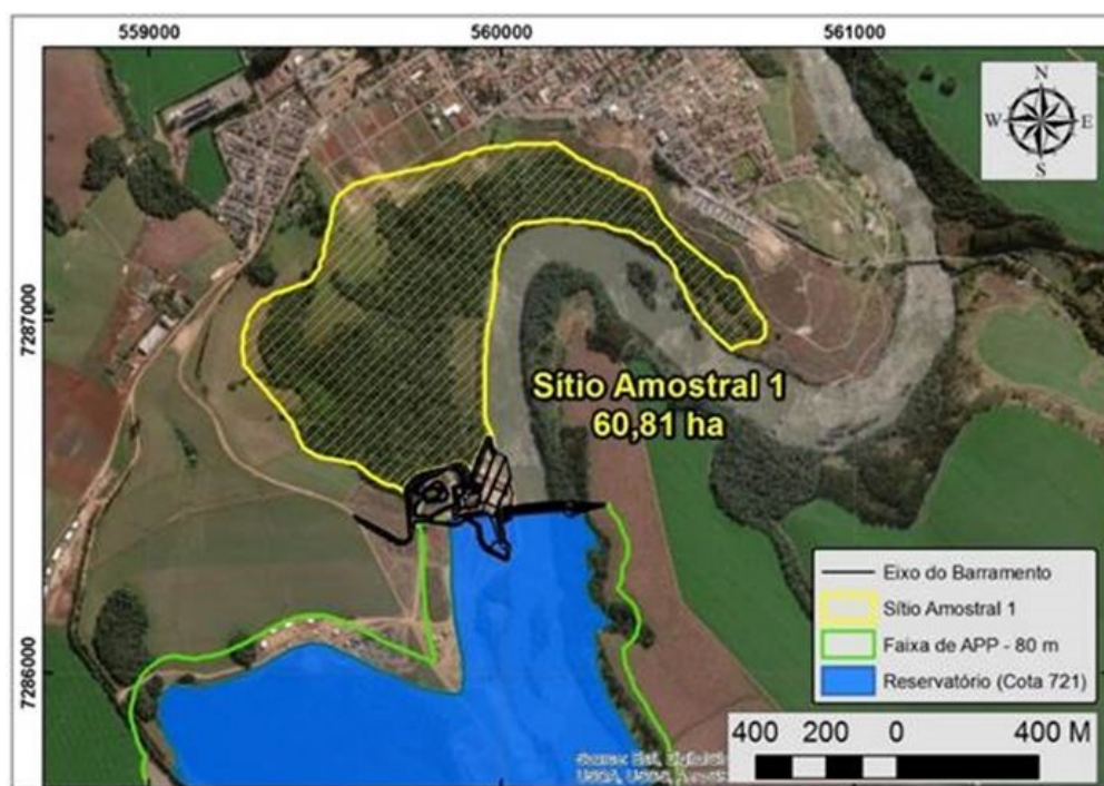
Figura 3.1.1.1 Localização do Sítio Amostral 1

Localizado a jusante da barragem da UHE Tibagi Montante, na margem esquerda do rio Tibagi, próximo às imediações da cidade de mesmo nome. O Sítio Amostral 1 possui uma área de 60,81 ha e contempla um remanescente de Floresta Ombrófila Mista com influência da Floresta Estacional Semidecidual.