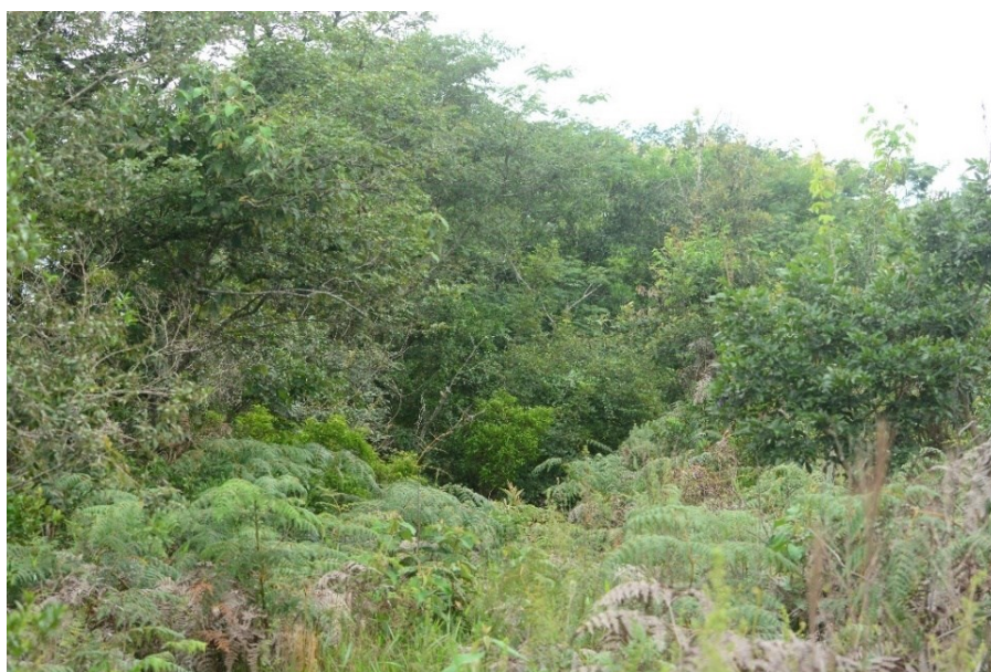
Figura 3.1.1.3 Ambiente de campo sujo em regeneração amostrado na margem do rio Tibagi (a jusante da barragem) que vem sendo monitorada durante os estudos de fauna para a UHE Tibagi Montante (sítio amostral 1).